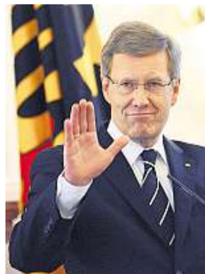
Will im Amt bleiben: Bundespräsident Christian Wulff.