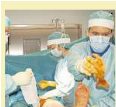
Der erste Eingriff: Ein neuer Operationsaal im Spital Schwyz. Bild im