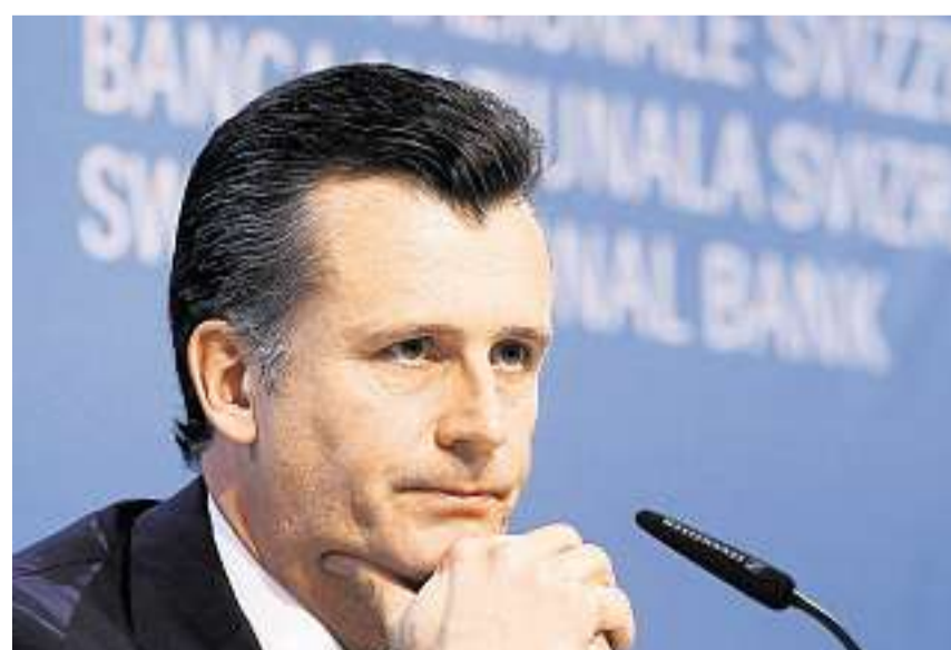
Will heute zu den neusten Vorwürfen Stellung nehmen: Nationalbankpräsident Philipp Hildebrand.

In der Folge veröffentlichte auch der Bundesrat ein Dokument zur Causa Hildebrand. Der Bericht, verfasst durch den Direktor und den Vizedirektor der Eidgenössischen Finanzkontrolle, bestätigt die Befunde der Revisionsstelle. Heute will Hildebrand Stellung zu den Vorwürfen nehmen. (red) SEITEN 17 UND 18