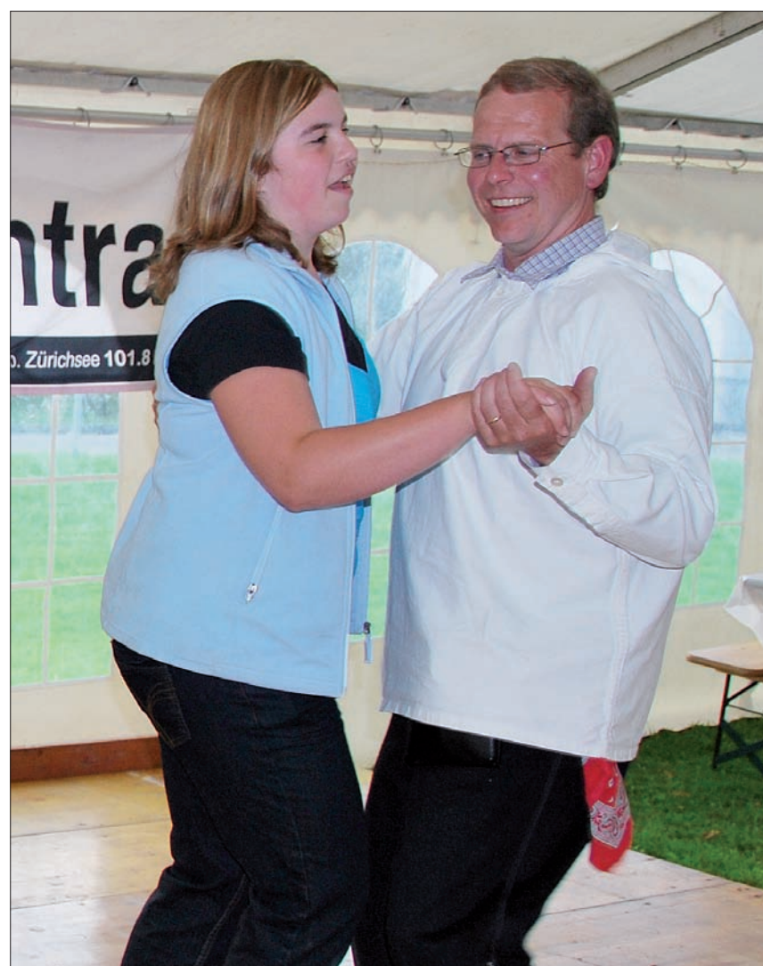
Auf der Tanzfläche wurde gedreht, geschwungen und getanzt.

gendliche und Erwachsene separat aus, an der Remise-Chilbi bot sich ein durchaus gemischtes Bild von jungen, älteren und jung gebliebenen Menschen, die dem Charme einer Chilbi unter der Remise erlegen sind. Wem es im Festzelt zu eng wurde, konnte kurz nach draussen gehen, frische Luft schnappen und zu den Sounds von DJ Dachs im Barwagen gegenüber wechseln.